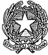
Ministero della Pubblica Istruzione