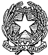
Ministero della Pubblica Istruzione